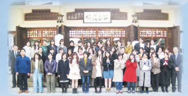
みんなで合格祈願