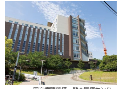
国立病院機構 熊本医療センター