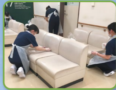
看護の日(清掃ボランティア)