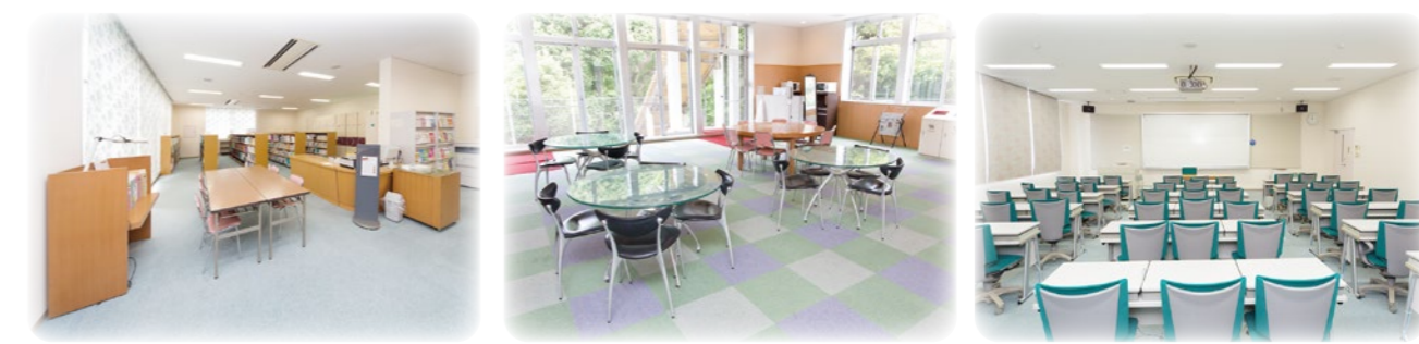
図書室 書籍や看護雑誌、DVDが揃っています。 学生ラウンジ 休み時間に、学生がくつろげる空間です。 情報科学室 パソコンでの資料作りやインターネット学習の場としても活用しています。環境が整備されています。