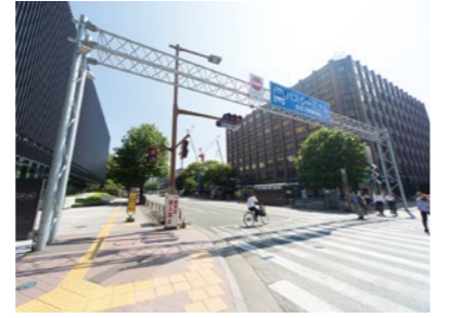
仮バスターミナル