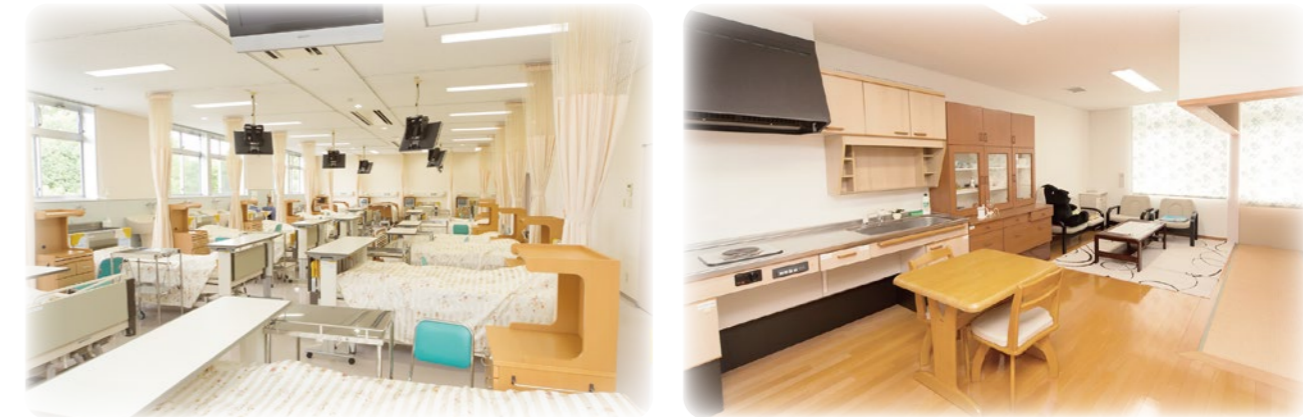
基礎看護実習室 実際の医療の現場に近い環境で学ぶことができます。 在宅看護実習室 居宅環境をイメージした実習室で、在宅看護を学びます。