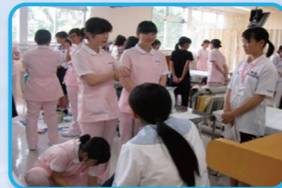
オープンキャンパス