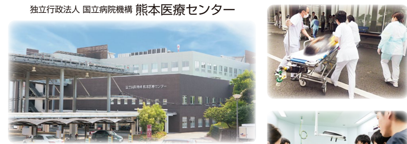
独立行政法人 国立病院機構 熊本医療センター 救命救急医療と高度先進医療を担う急性期総合病院です。 ●熊本県の中核を担う救命救急センター ●地域医療支援病院 ●災害拠点病院 ●地域がん診療連携拠点病院