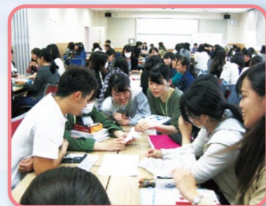
学生交流会 学生を支援するのは教職員だけではなく、学生同士でも。