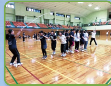
学生交流会(スポーツ大会)