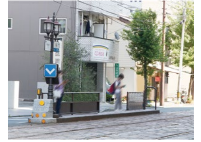
熊本市電B系統 蔚山町駅