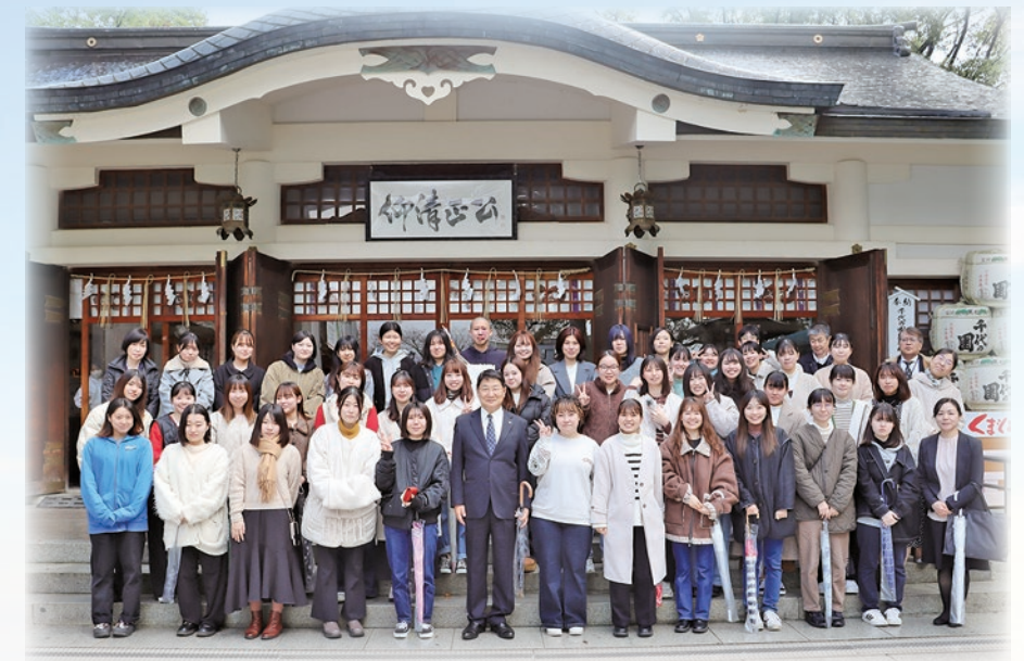
みんなで合格祈願