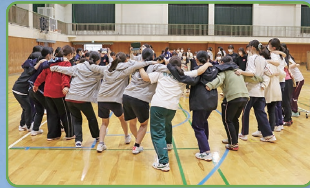
学生交流会(スポーツ大会)