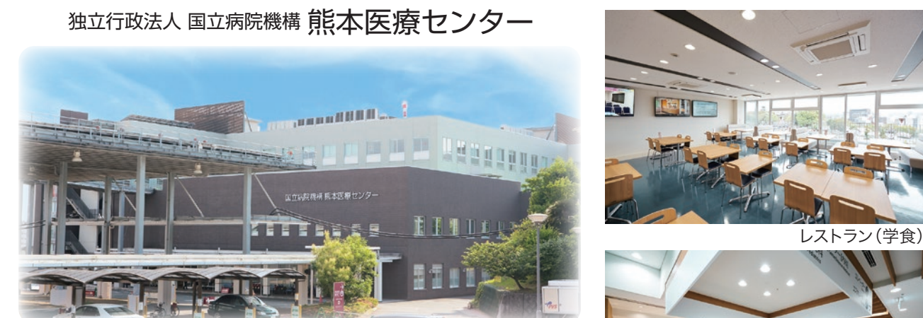
独立行政法人 国立病院機構 熊本医療センター レストラン(学食) カフェ 救命救急医療と高度先進医療を担う急性期総合病院です。 ●熊本県の中核を担う救命救急センター ●地域医療支援病院 ●災害拠点病院 ●地域がん診療連携拠点病院