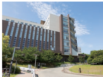
国立病院機構 熊本医療センター