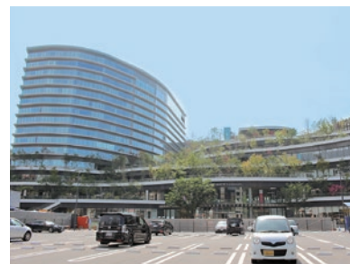
サクラマチクマモト