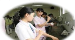
看護技術体験の様子