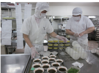
1年を通して調理室内温度25℃以下湿度50%以下で保たれています