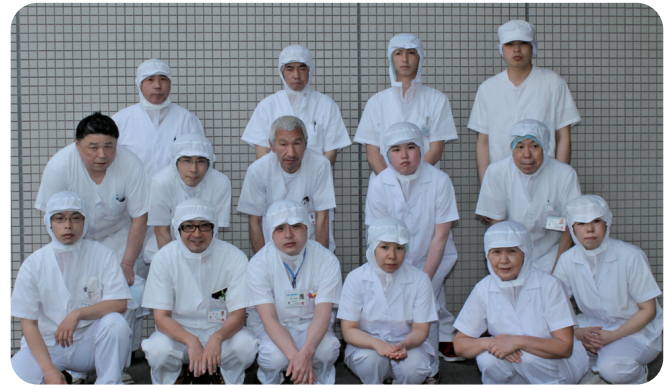
若き人材と経験豊富なスタッフが揃っております

栄養管理室は、管理栄養士10名（職員7名、非常勤3名）、調理師6名と委託職員25名（栄養士・調理師・調理員）の総勢41名のメンバーで、1日1,300～1,400食の食事を提供しています。毎朝のミーティングでの献立確認や月1回委託を含めた勉強会を通して、より協力体制を深め、安心して安全な食事の提供を目指して日々励んでいます。