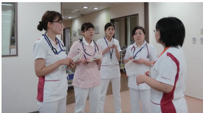
救命病棟で実践されている看護を見学

救急看護に関する知識の向上を目的に、フィジカルアセスメントやメンタルアセスメント、救急医療の講義が行われました。その後、学んだ内容を参考に、受講生が経験した実症例をグループディスカッションし、再現した内容のシミュレーションを行いました。課題別研修として、自施設で学んだことをどう活かすかグループワークを行い、まとめを発表しました。