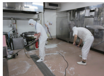
配膳終了後、日々の清掃に徹底します