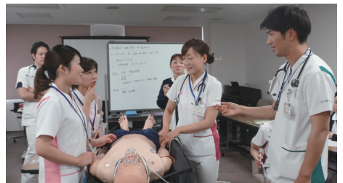
シミュレーターを用いて学ぶフィジカルアセスメントの基礎

また、講義とは別に初日に意見交換会を行い、食事をしながら各施設での取り組みや問題点を語り合い情報を共有しました。