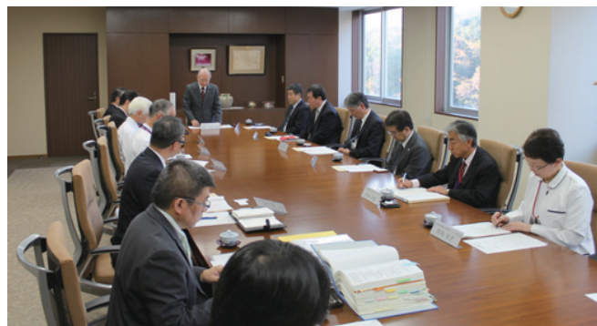
地域医療支援病院運営委員会の様子

地域医療支援病院として承認を受け、13年目を迎えました。昨年、承認要件の見直しがありました紹介率も要件を満たして推移しております。これも一重に開