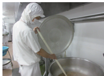
一度に大量調理が可能です