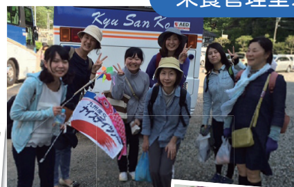
有田陶器市に行ってきました