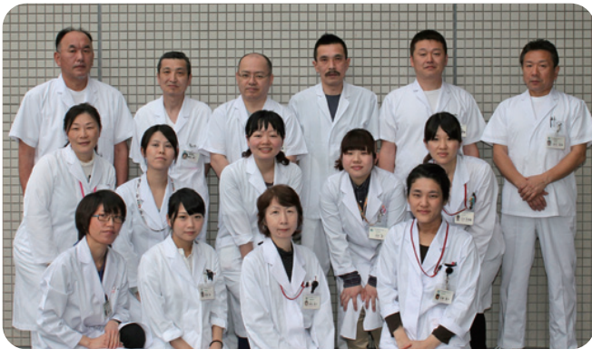
“縁の下の力持ち”で頑張っています