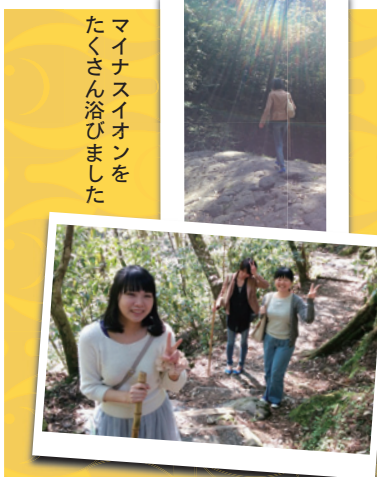
マイナスイオンをたくさん浴びました