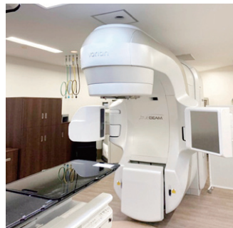
図1 放射線治療装置 TrueBeam

照射時間はほとんどの治療であれば1分程度であり、また治療中に痛みなど感じることはありません。ただし、治療中に体を動かしてしまうと合わせた位置がずれてしまい、放射線をあてたいところにあたらなくなる可能性がありますので動かないようにお願いします。