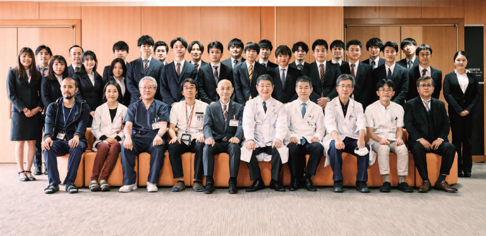
令和4年度 臨床研修医