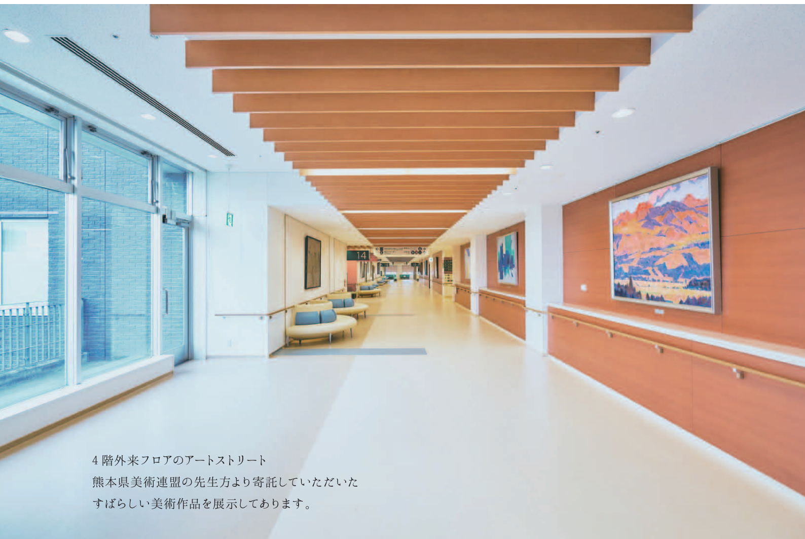
4階外来フロアのアートストリート 熊本県美術連盟の先生方より寄託していただいた すばらしい美術作品を展示してあります。