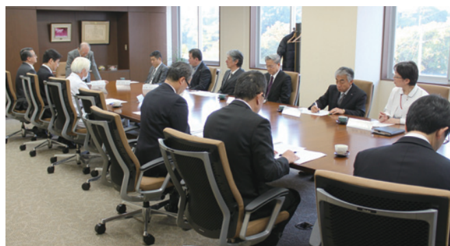
地域医療支援病院運営委員会の様子

地域医療支援病院として承認を受け、12年目を迎えました。これも一重に開放型病院登録医の先生方をは