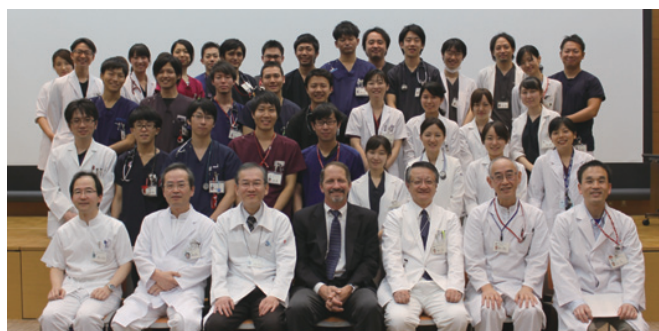
ジェフリー・ヘーゲン先生と記念撮影

私たち研修医は英語で症例報告、病棟回診のプレゼンテーションを行いました。英語での発表は難しく、大変緊張しました。自分の英語力、語彙力の弱さを実