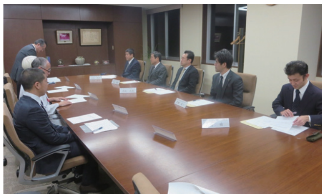
熊本市歯科医師会・国立病院機構熊本医療センター連絡協議会の様子