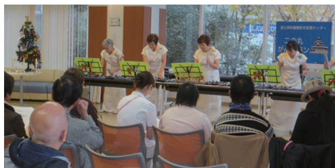
Xmasコンサートの様子

トーンチャイムはアメリカで作られたリハビリ用の楽器で優しい音色が奏でられます。美齡重様は約10年前から病院や施設などで多岐にわたって演奏活動をされており、この丸がんサロンで演奏頂くのも3度目となりました。たくさんのクリスマスソングを奏でて頂