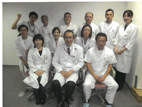
内科部長初め栄養士、調理師です