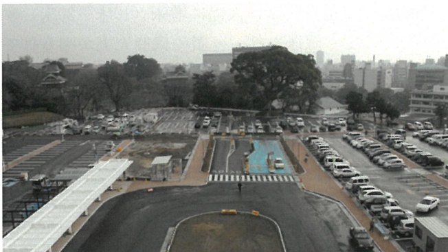
屋上から見た駐車場全景（平成22年12月20日現在）

駐車場整備の開始から約1年、この度、ようやく旧病棟跡地に約520台が収容可能な駐車場が完成し、1月中旬には全面的に共用開始となります。病院玄関口の左手から垂直に延びた約42mの白い屋根付きの車寄せにより、雨に濡れずに玄関口まで行くことができます。また、この車寄せの熊本城側には「車椅子利用者専用駐車場」を7ヶ所設置しております。全体的に熊本城の一角という地域性を考慮し、植栽帯を多く確保する等、環境にも優しいレイアウトになっており、何より、来院の方々の利便性が格段に向上するものと期待しております。