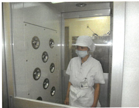
衣類に付着している髪の毛や糸くず等を取り除いてくれるエアシャワーです