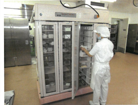
配膳車に入れ込む作業をしています