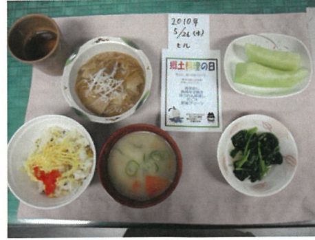
今年から始めた郷土料理です 熊本食（タカナメシ・だご汁）