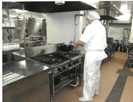
災害に備えて電磁気、ガス台も設備しています