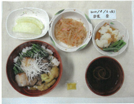
角煮丼は、選択メニューでも人気メニューの1つです