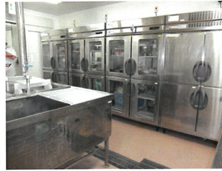
下処理した野菜類は冷蔵庫に入れ、調理場から取り出します