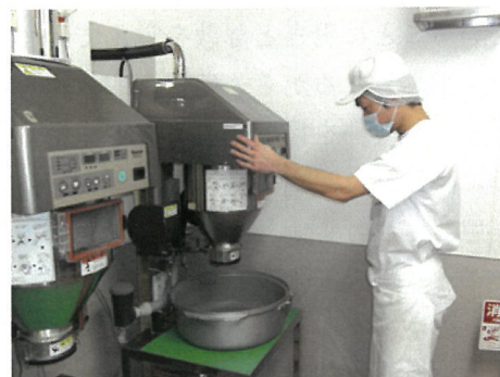
洗米・計量から炊飯までオートシステムです